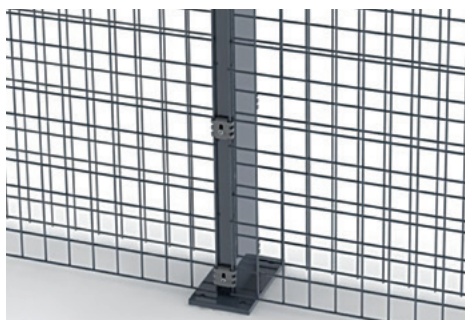
Zenturo palen met aangelaste voetplaat tot 2 m op aanvraag verkrijgbaar